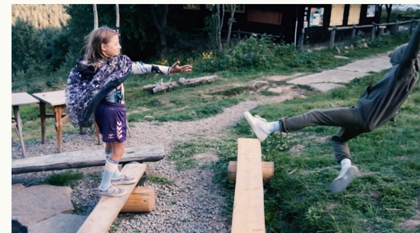
kadry z filmu Super Frania i zatruwacze jagódek . Do obejrzenia tu: LINK